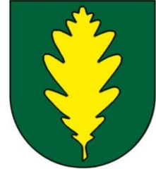
Obrázok 2 Erb obce

Erb obce Dúbravka tvorí v zelenom štíte zlatý dubový list. Erb obce je zapísaný v Heraldickom registri Slovenskej republiky pod signatúrou D-20/1992.